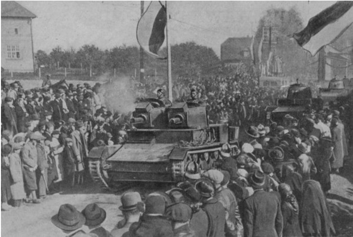
Польские войска вступают в Тешинскую область

Как уже говорилось выше, в ночь с 29 на 30 сентября 1938 года было заключено печально известное Мюнхенское соглашение. Стремясь любой ценой «умиротворить» Гитлера, Англия и Франция цинично сдали ему своего союзника Чехословакию. В тот же день, 30 сентября, Варшава предъявила Праге новый ультиматум, требуя немедленного удовлетворения своих претензий 255 . В результате 1 октября Чехословакия уступила Польше область, где проживало 80 тыс. поляков и 120 тыс. чехов 256 .