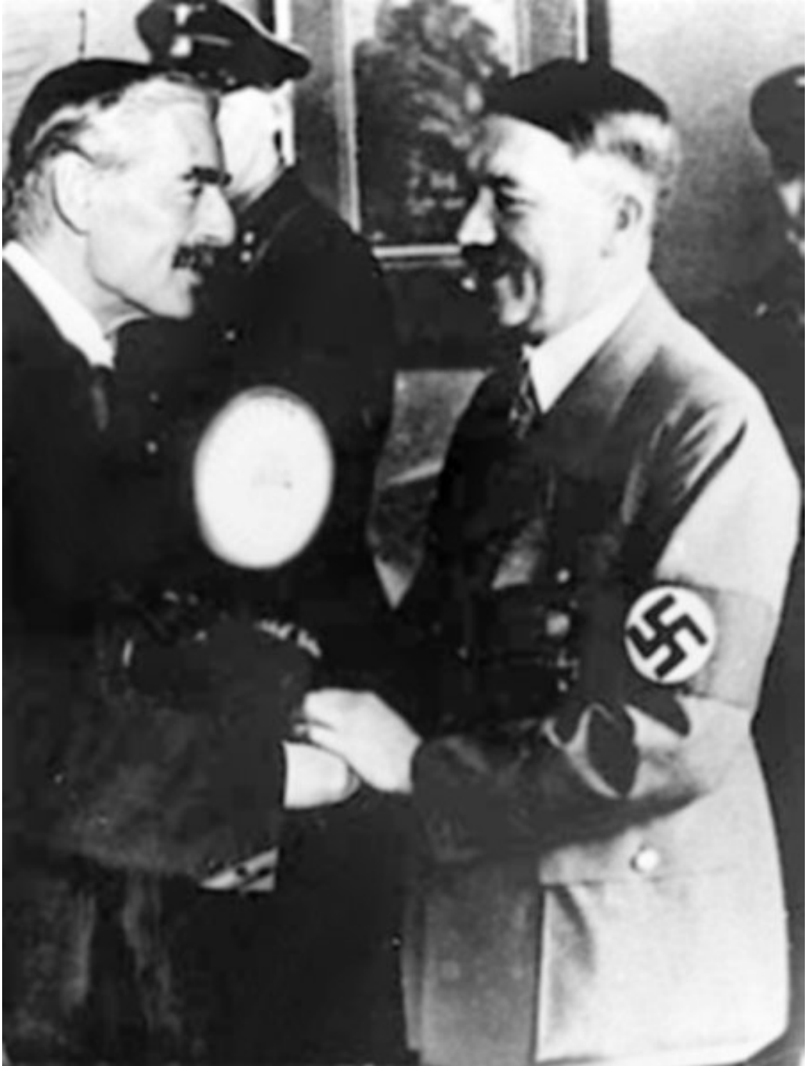
«Друг Невилл и друг Адольф». Встреча Гитлера с Чемберленом.

Однако едва дошло до дела, как выяснилось, что западные демократии вовсе не горят желанием защищать Чехословакию. 15 сентября 1938 года английский премьер-министр Невилл Чемберлен посетил Гитлера в его резиденции в Берхтесгадене. Фюрер был непреклонен. 19 сентября послы Англии и Франции передали Чехословакии совместное заявление своих правительств о том, что необходимо уступить Германии районы, населённые преиму-