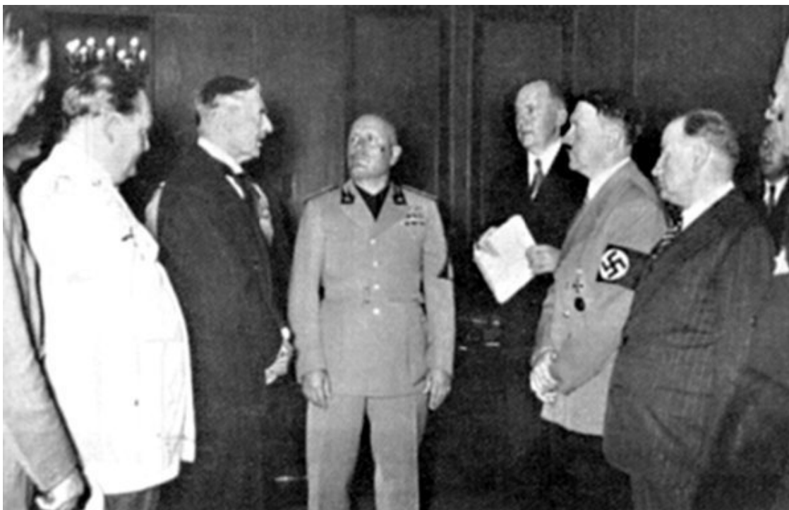
На Мюнхенской конференции. Слева направо: Г. Геринг (толстый, в белом кителе), Н. Чемберлен, Б. Муссолини, И. фон Риббентроп, А. Гитлер, Э. Даладьё.

О том, чего эти гарантии стоили, наглядно свидетельствует дальнейшее развитие событий. 13 марта 1939 года лидеры словацких националистов объявили о «независимости» Словакии и обратились к Германии с просьбой о защите. 15 марта немецкие войска вошли в Прагу. Великобритания и Франция не сделали и попытки спасти Чехословакию, ограничившись вялыми протестами. По свидетельству статс-секретаря министерства иностранных дел Германии Эрнста фон Вайцеккера, посетивший его 15 марта французский посол в Берлине Робер Кулондр «с некоторым волнением говорил о том, как сильно на него подействовало вступление наших войск [в Чехословакию], которое находится в противоречии с мюнхенским соглашением, в противоречии с теми отношениями доверия, которое, по его мнению, он встретил у нас» 208 .