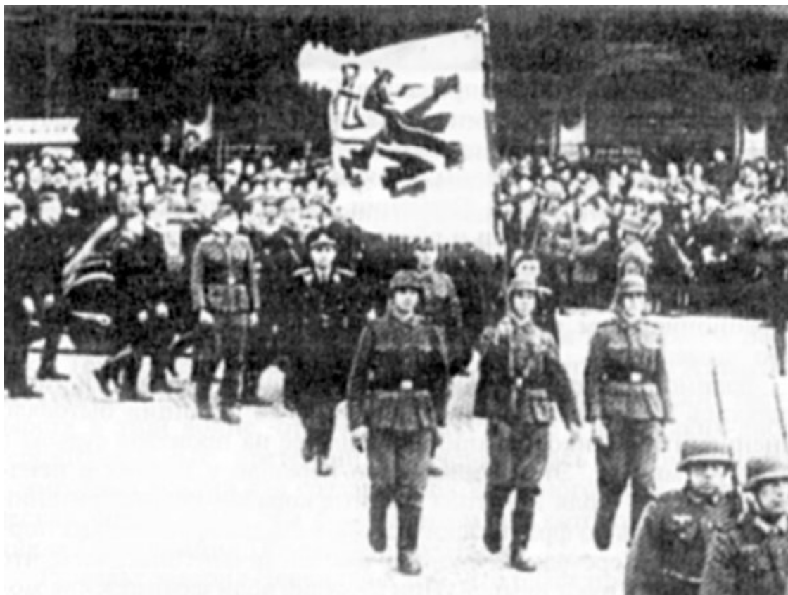
Брюссель. Парад легиона «Фландрия». Впоследствии на его основе будет сформирована сперва бригада, а затем 27-я пехотная дивизия СС «Лангемарк».

Насчёт Словакии и Хорватии всё ясно – это марионеточные государства, созданные после оккупации Гитлером Чехословакии и Югославии. Проводить самостоятельную политику они в принципе неспособны.