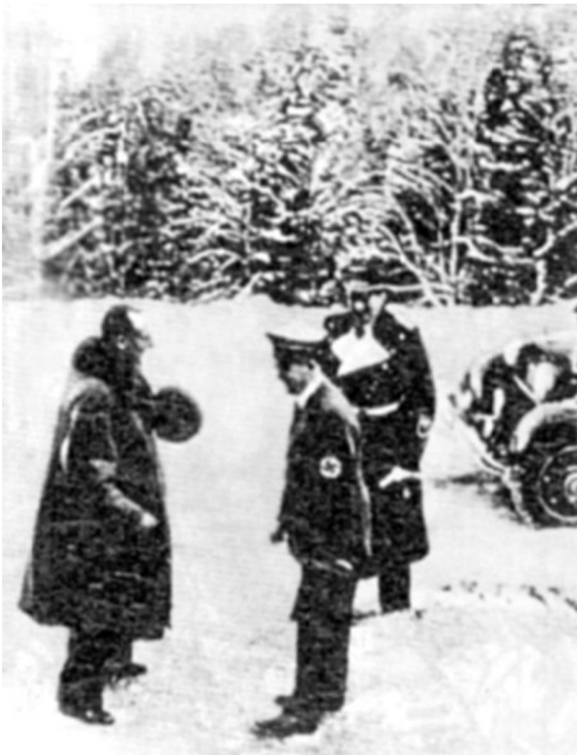
Визит польского министра иностранных дел Юзефа Бека к Гитлеру. 1938 год.

Тем не менее поляки, выражаясь словами известного писателя-сатирика Михаила Зощенко, «затаили хамство» и, когда немцы потребовали у Праги Судеты, решили, что настал подходящий случай добиться своего. 14 января 1938 года Гитлер принял министра иностранных дел Польши Юзефа Бека. «Чешское государство в его нынешнем виде невозможно сохранить, ибо оно представляет собой в результате губительной политики чехов в Средней Европе небезопасное место – коммунистический очаг», – изрёк вождь Третьего рейха. Разумеется, как