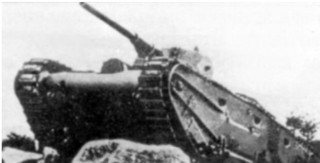
«Большие трактора». Масса 15–19,3 т, экипаж 6 человек, вооружение – 75-мм орудие и 3–4 пулемёта. – Усов М. Военно-техническое сотрудничество с иностранными государствами // Техника и вооружение. 2004. № 7. С.6.