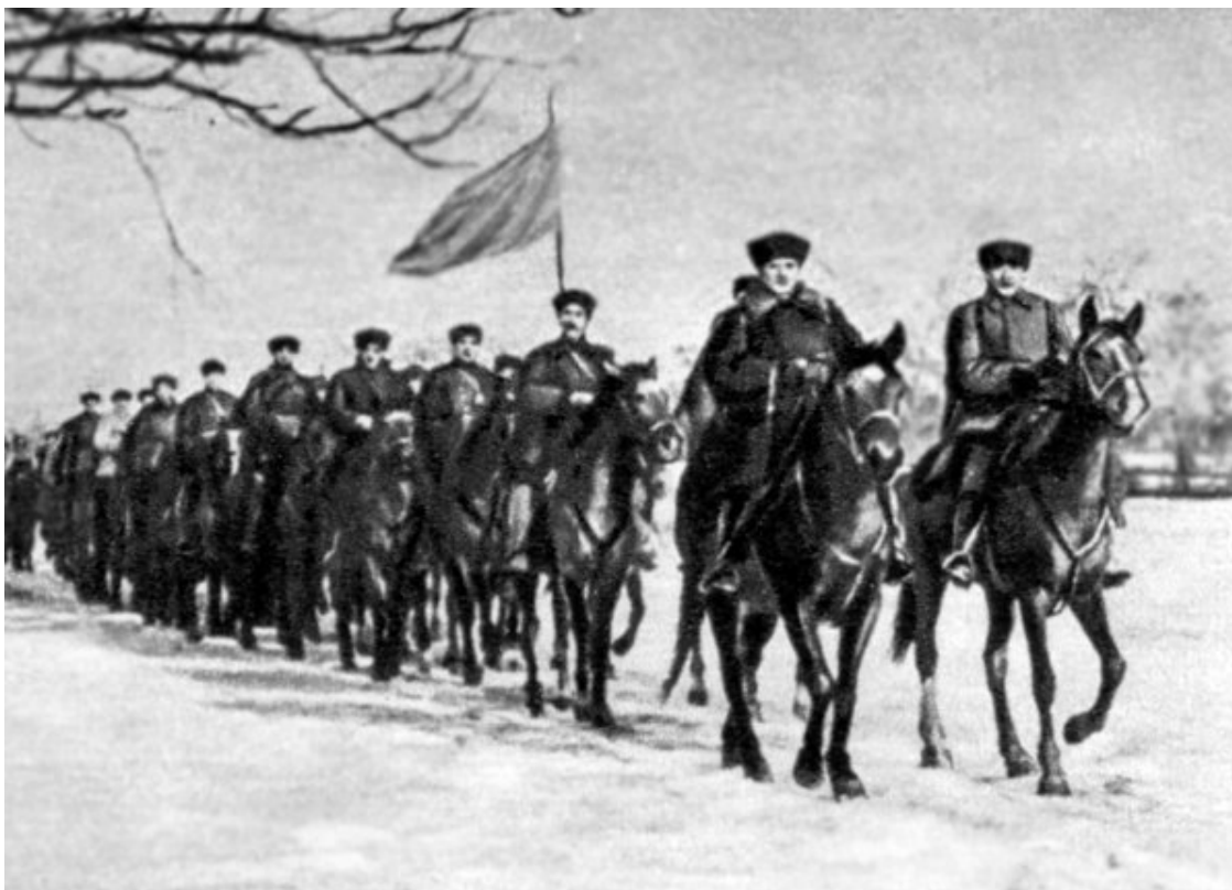
Красная Армия. Кавалерийский полк на марше

Мудрый Шапошников как в воду глядел. Лёгкие кавалерийские дивизии трёхтысячного состава, создаваемые по настоянию Будённого, а их было сформировано ни много ни мало около 100, предпринимали попытки рейдов по тылам фашистских войск. Некоторым кавдивизиям сопутствовала удача. Однако былинные времена, породившие легенды о красных конниках, прошли. Эта война была войной моторов, и кавалерия оказалась способной выполнять лишь второстепенные, вспомогательные задачи. Но Будённый упрямо гнул свою линию – даже после того, как “летучие кавдивизии”, не имевшие надёжных средств ПВО и не обладавшие достаточной ударной мощью, понесли громадные потери. Он всячески сопротивлялся сокращению кавалерийских соединений. К концу войны их оставалось 26. Было в них что-то от петровских потешных полков – в угоду одному человеку, которого не хотели обидеть, оставив без любимых игрушек» 187 .