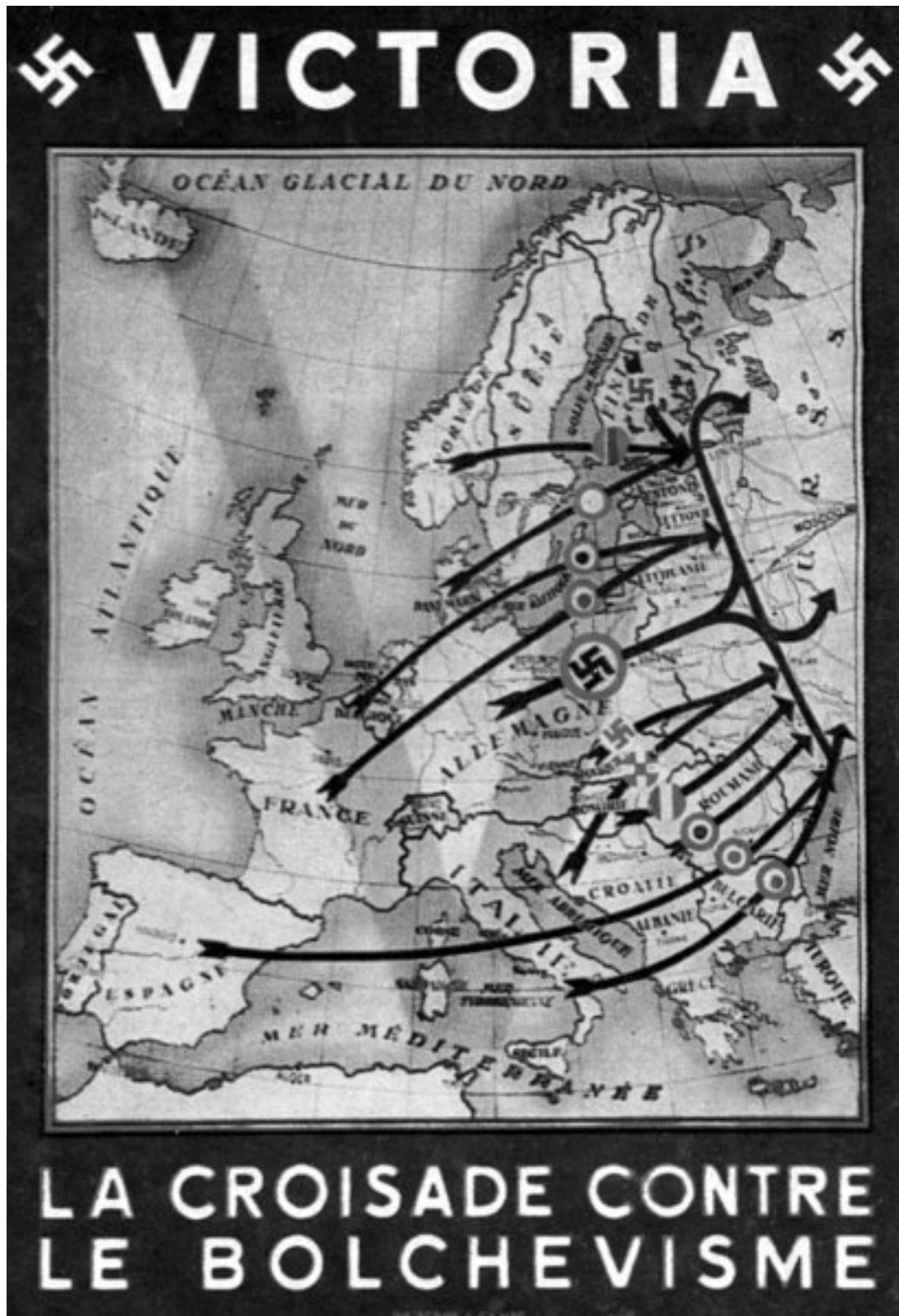
Крестовый поход гитлеровской «Объединённой Европы» против нашей страны