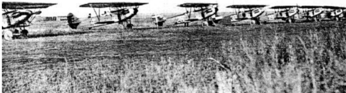
Истребители «Фоккер Д-ХІІІ» на лётном поле липецкой авиашколы

и все транспортные расходы, в том числе и перевозку по советской территории от Ленинградского порта до Липецка 32 .