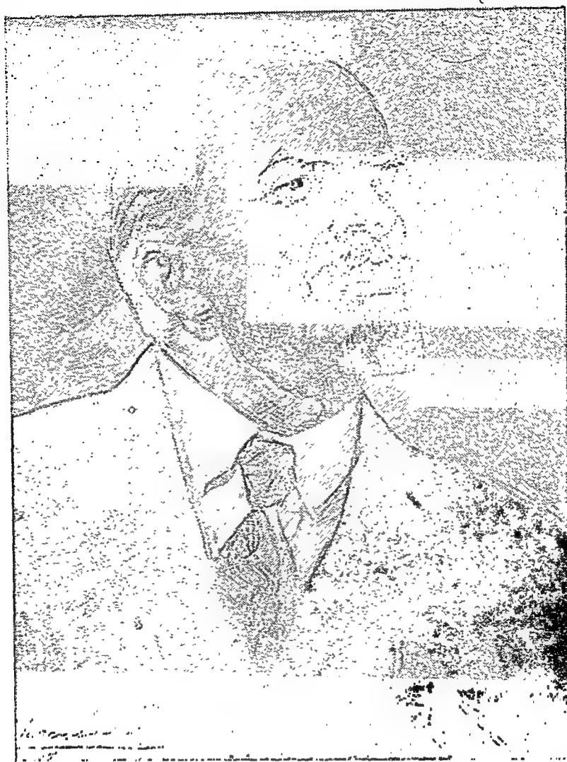
बोल्शेविक क्रान्ति के जन्म-दाता कामरेड वी० आई० लेनिन ( १८७० — १९२४ )