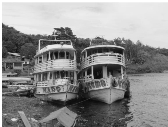
Muküi igarité uiku uaá Paranãuasú upé, São Gabriel da Cachoeira upé, Amazonas